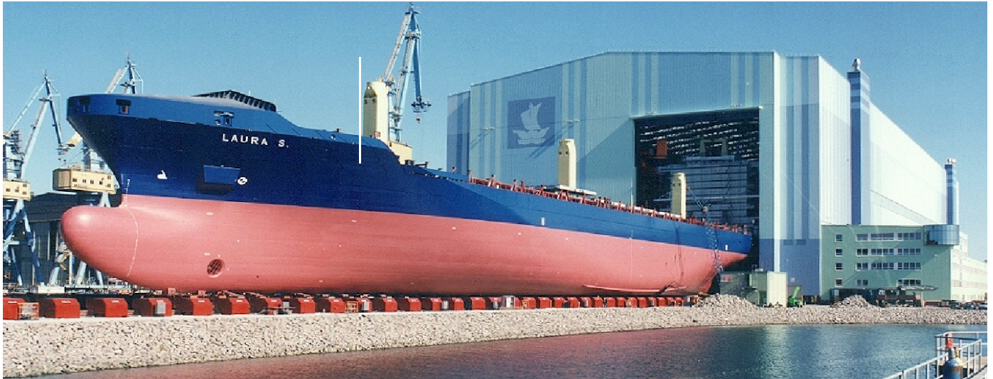
Das 250 m lange Containerschiff "Laura" verläßt die Schiffbaumontagehalle 290

1999 in London mit dem Europäischen Stahlbaupreis ausgezeichnet